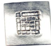
Bosche und Ohrstecker, 925 Sterlingsilber