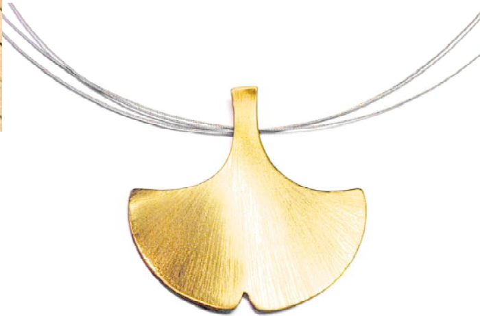
Halsschmuck und Gürtelschnalle, 925 Sterlingsilber, teilweise feinvergoldet