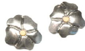
Halschmuck, Ohrstecker und Brosche, Lapis-Lazuli/925 Sterlingsilber/750 Gelbgold