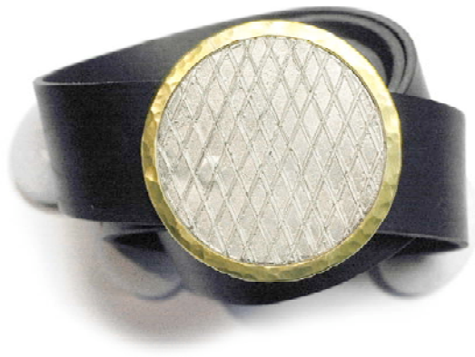
Gürtelschnalle, 925 Sterlingsilber/Messing