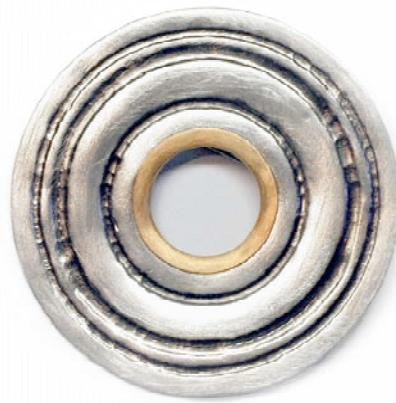
Brosche, 925 Sterlingsilber/Feingold